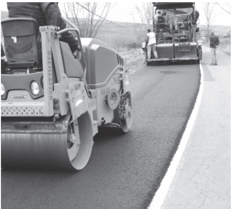
December közepéig folytak a javítási munkálatok a megye útjain