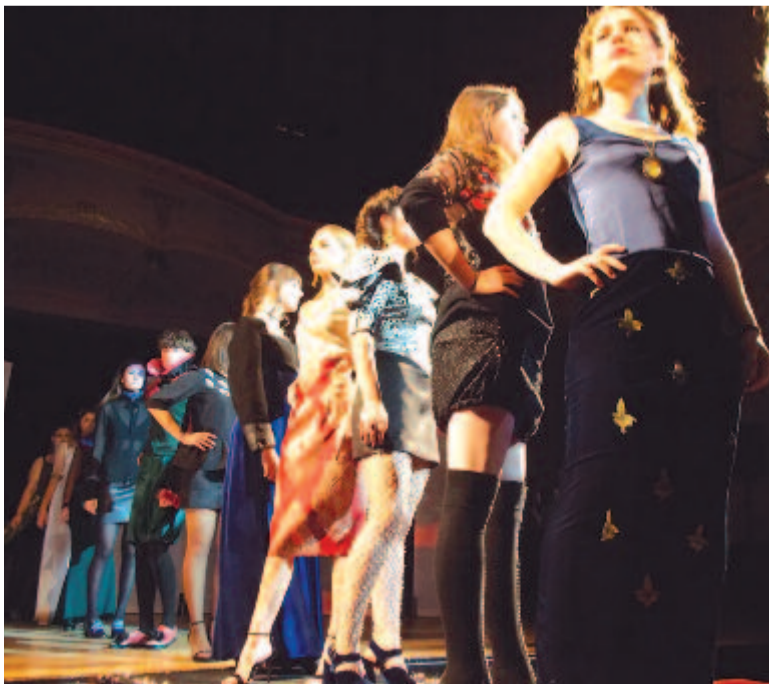
A művészeti lányok