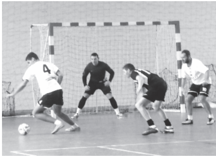
Az alakulatok mintegy fele szinte azonos szintű játékerőt képvisel, ezért látványos és gólgazdag mérkőzéseknek is szemtanúja lehetett a közönség.

Ákosfalván téli kispályás labdarúgóturna kezdődött decemberben. A nyolcadik alkalommal meghirdetett pontvadászatra tucatnyi csapat iratkozott be.